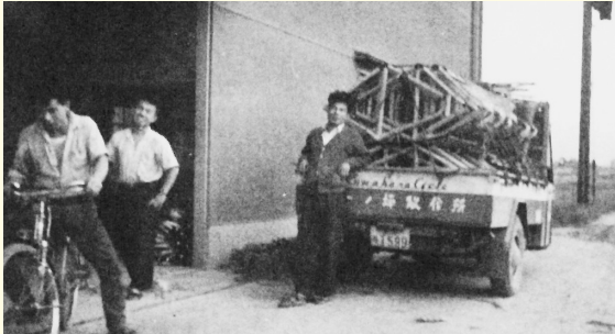
自転車の需要は旺盛で、自社トラックで次々とフレームを出荷していた。

最初は、この塗装ラインがうまく稼働せず、一週間かけて、ほとんど寝ずに対策に取り組みました。塗装設備は自社工場の形に合わせた専用設計ですので、他社に売却することもできず、使わなければスクラップにするしかありません。最終的に塗料に使う希釈剤に問題があると分かり、何とかうまく稼働させることができました。