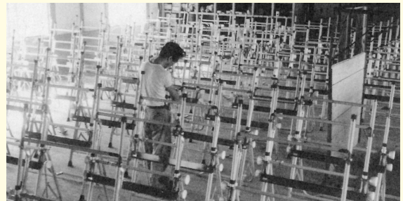
ズラリと並んだ製図台

同じような鋼材パイプを加工して造るといっても、自転車フレームと製図台の脚部とはまったく違う仕事です。自転車なら規格品のパイプを切っただけですが、製図台は曲げ加工で一から造っていく必要があります。それまで使ったことのないプレス式のパイプベンダーを購入し、金型も起こしました。手間はかかり苦勞しましたが、うまく改善することができました。