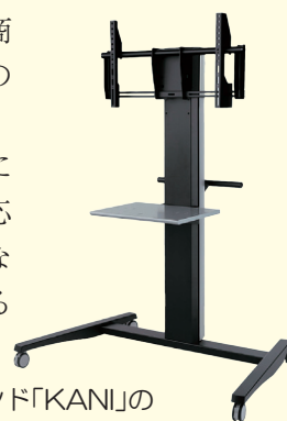
オリジナルブランド「KANI」のディスプレイスタンド

これからも顧客の信頼に応える企画提案と生産対応力を発揮し、さらに活発な事業展開を進めていかれることでしょう。