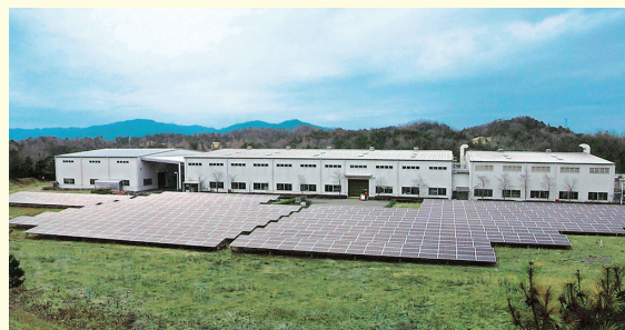
14,000 坪という広大な敷地に新設した三重工場後に増築し、ソーラーパネルも設置した。