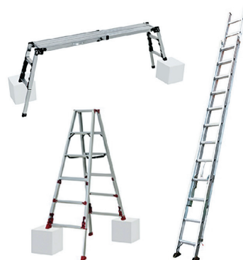
主力製品のアルミニウム製はしご・脚立・作業台

近年は油圧式・ウィンチ式の昇降作業台、各種物流機器の製造販売を展開し、また、新たな事業としてペット用品の製造・企画販売も行っております。