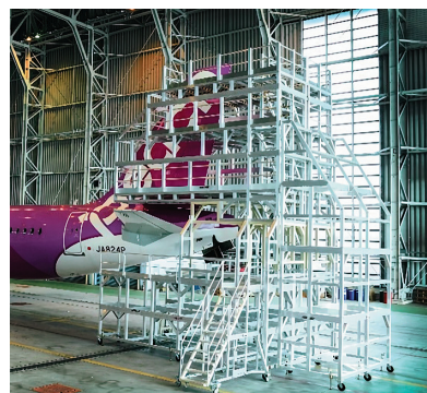
特注品(航空機点検用足場)

“PiCa”は、“People and Ideas in Creative Action”つまり、「創造性あふれる人々とひらめき」が集まったチームであることを表わしています。ひと言で言えば「個性の輝き」。どこにもない鮮やかな個性を大切に磨きあげ、きらめく存在になりたいというわたしたちの願いがこめられています。そして個性輝く社員とともに、皆様の明日をささえてまいります。