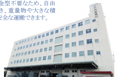
滋賀工場(滋賀県草津市)