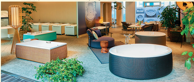
上：WAILEA（大阪）ショールーム 下：FLUSSO（東京）ショールーム