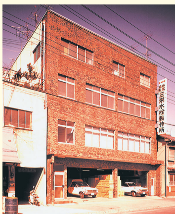
建設当時の本社ビル

こうしたなか付き合いのあった協力会社が廃業することになり、設備を引き取ってくれないかという申し出がありました。この話を受け、1966年に本社に隣接して工場を建設しました。初代工場長は、給水栓の製造工場を経営していた経験があり、ビルの水タンクや水洗トイレのタンクに取り付けるボールタップや給水栓等の製造に長けていたことから、これらの製品を新しい工場で作ることになりました。工場を得たことでボールタップや給水栓以外の水道関連製品においても自社での本格的生産を開始し、メーカーとしての認知を得ていくことになりました。機械工場建設の翌々年、1968年に本社ビルを建設しました。