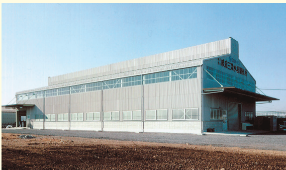
1980年、鋳造工場として岐阜三栄水栓製作所を新設。後に機械工場も増設し主力拠点となった。

その後、1982年に新工場は本社へ合併。1980年代から1990年代にかけて岐阜に各種工場を建設し、一貫生産体制を確立したのです。