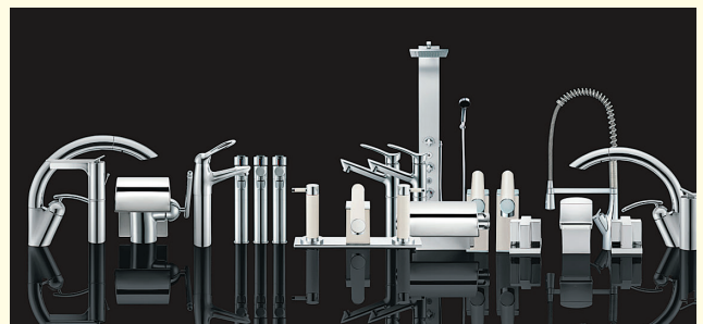
ニーズに応じて質の高さを追求