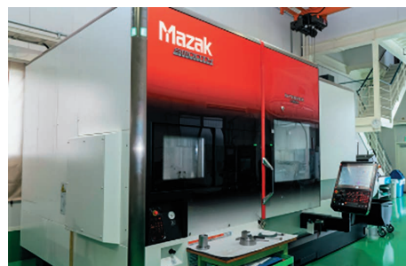
現場には高性能の工作機械を惜しみなく投入し難加工部品の製作にあっています

昭和47年に歯車屋として東大阪の地で創業。現在は丸物板物を問わず、あらゆる産業機械向け難加工部品の加工を主業としています。オーダーの98%が1点物であり、5工場が常にフル稼働の状況にあります。一方産業機械の1台組も得意としており、まさに“ワンストップ工場”を体現しています。