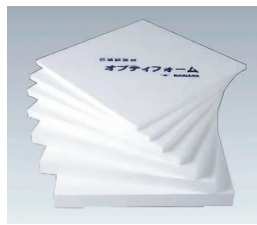
防蟻断熱材「オプティフォーム」

京都大学などと共同研究を重ね、シロアリ被害の多い和歌山県や鹿児島県で野外試験を10年以上行って実用化した、お勧めできる商品です。