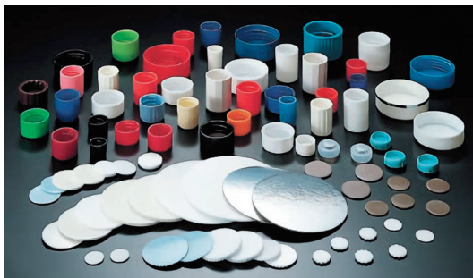
当社主力製品の各種パッキン

当社の最初期から一貫して使用している材料はコルクです。コルクの木は地中海性気候でしか自生できず、日本では育てることが難しいため創業以来ポルトガルからの輸入に頼っています。創業時はコルク栓を主力製品としていましたが、目薬や化粧品、お酒の瓶など幅広い容器メーカー様に使用されていきました。またビールの王冠に使用されているコルク(以降コルクディスク)の生産もしていました。コルクのもつ機能ごとに、パッキン、スーパーコルクガスケット、発泡スチロール(EPS)といった製品に変化していきました。